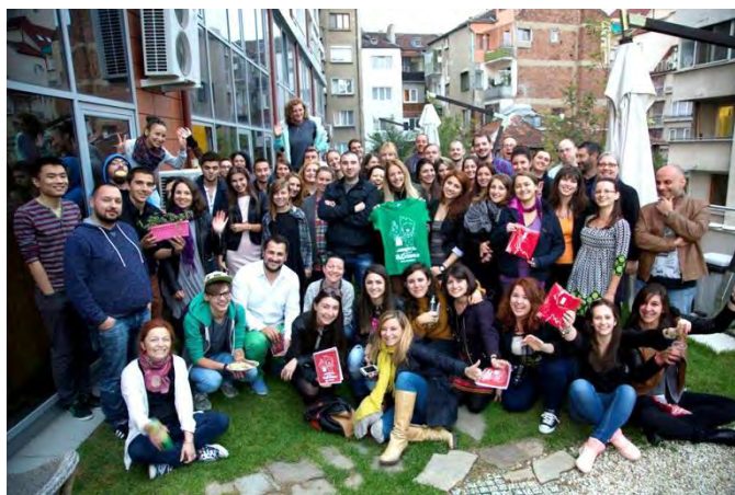
Фиг.2 Студенти от AUBG през деня на отворените врати в All Channels.

Висока атестация за съвместната ни работа с AUBG е, че преподавателите от факултета препоръчват All Channels като качествен доставчик на стажове на своите студенти.